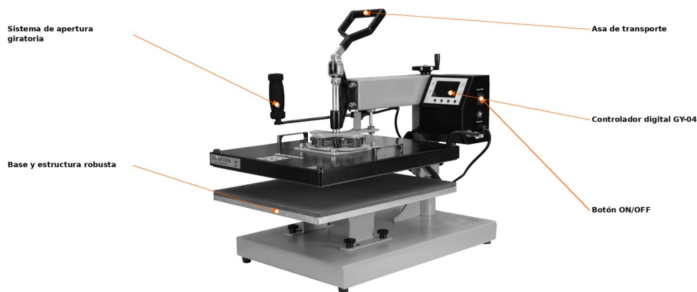
Fig. 1 · Componenti principali della macchina Beinsen Jamaica.