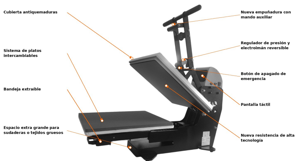
Fig. 1 · Componentes principales del equipo Beinsen Malvinas.